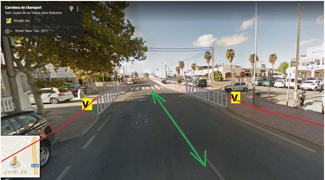
Davant ca'n Tixedó.