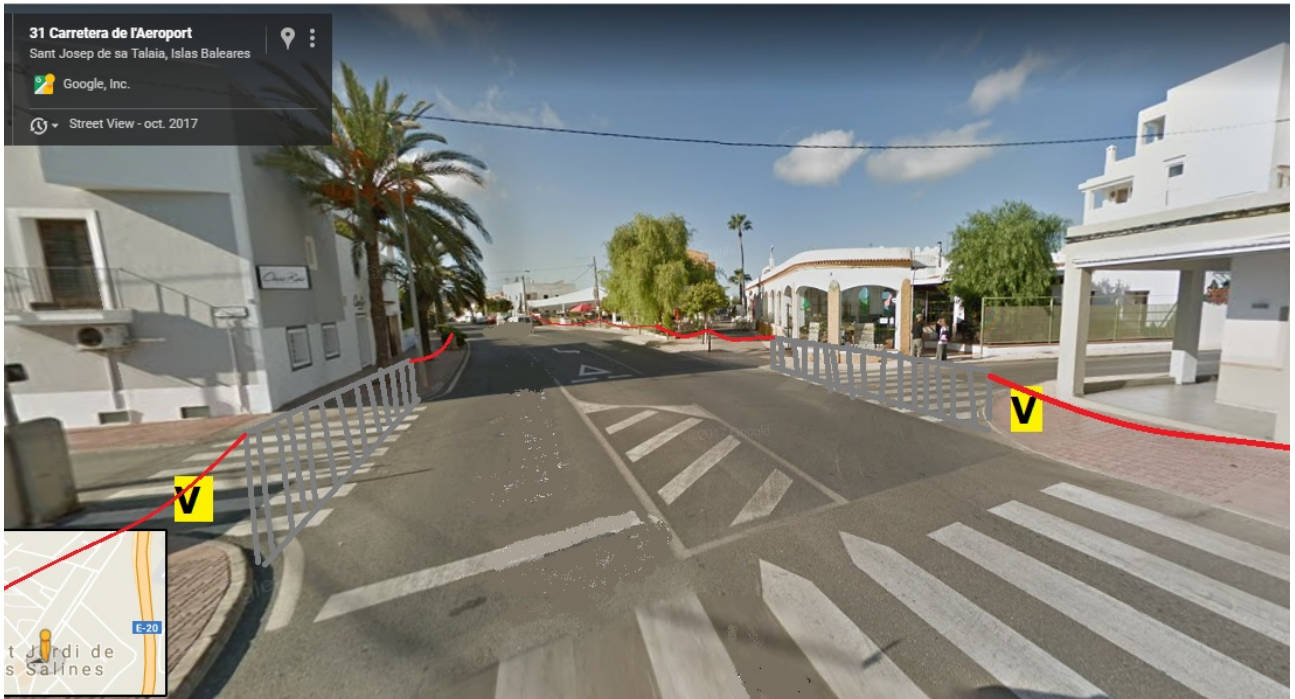
Davant es Vinyl Burguer.